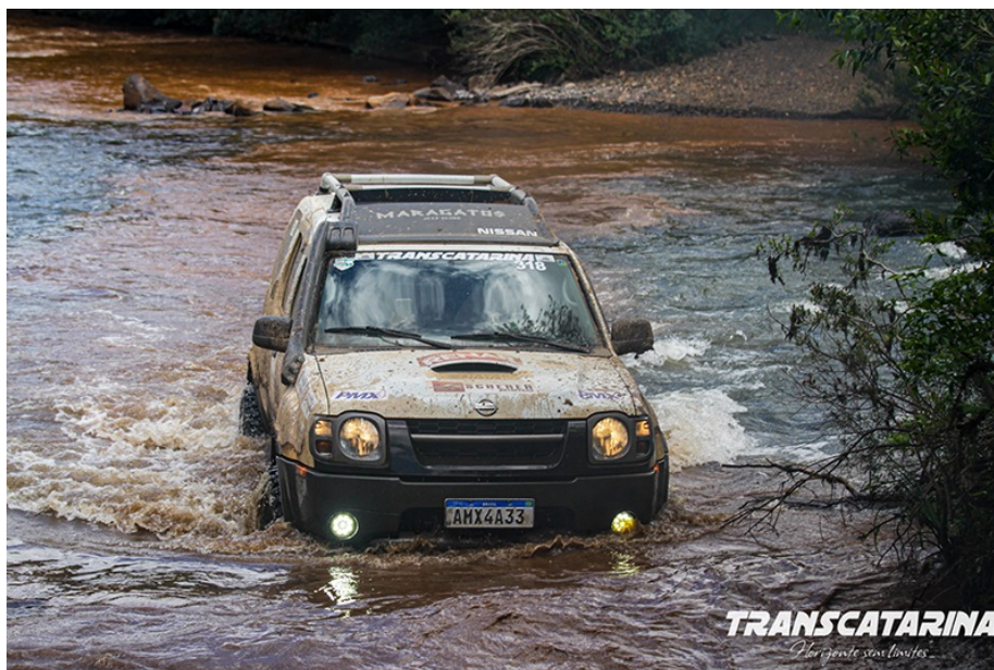
O evento tem largada na cidade de Fraiburgo, SC

Após dois meses da abertura das inscrições para o Transcatarina 2022, o evento já tem 160 veículos confirmados, com pessoas vindas de dez estados brasileiros